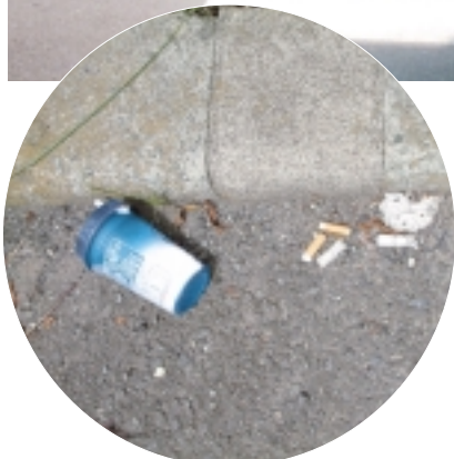
路上に散乱する吸い殻など(原町田)