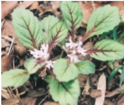
ツクバキンモンソウ (06・4・17三輪町で撮影)

「これ、ジュウニヒトエかしら」「ちよっと葉の色が違うよ、濃い紫色のすじが入っている」。 周りにも同じ模様の葉を付けた草