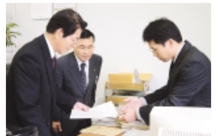
要請書類を米軍側に手渡す 町田市企画部長(中央)、相模原市担当部長(左)

要請活動等に関するお問い合わせ先 環境・産業部環境保全課 ☎724・2711 企画部企画調整課 ☎724・2103