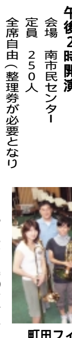
町田フィル・金管アンサンブル

【2月15日午前8時30分から町田市民ホール、南市民センターで入場整理券配布(入場無料)】