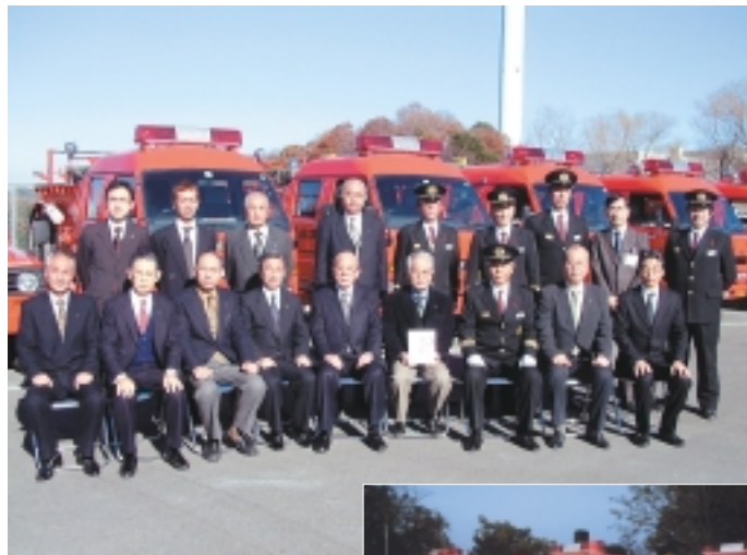
引退する消防車を有効活用 海外で再利用されます

市では家庭から排出される容器や包装に使われたプラスチックを容器包装リサイクル法に基づき、分別収集、資源化することを計画し、そのために必要となる中間処理施設を事業者が小山ヶ丘2丁目に建設する予定で準備を進めています。