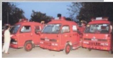
フィリピンで活躍中の昨年の車両