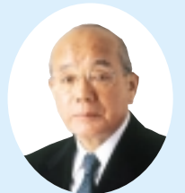
町田市長 寺田和雄