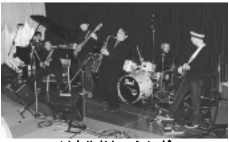
ソウルドレッシング

ここに掲載した催し物は、一般市民の入場可能な催し物(政治団体、宗教団体等が主催するものを除く)です。定員になり次第入場をお断りします。内容等は変更する場合があります。1月の休館日は1～4日、16日です。