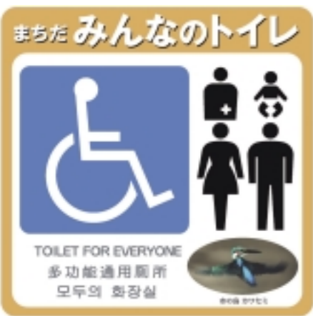
推奨マークの無断転用は禁止です