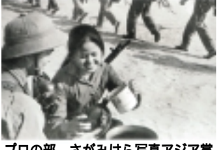
プロの部 さがみはら写真アジア賞 ドアン・コン・ティンさん(ベトナム)「重要な瞬間/ベトナム戦争の写真資料」より