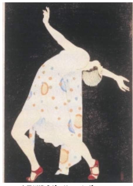
小早川清「ダンサー(レビュー)」 1932年(昭和7年)千葉市美術館蔵