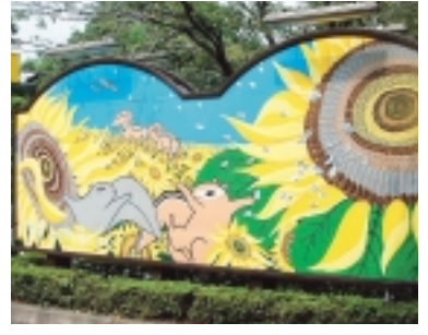
鮮やかに完成しました

町田リス園は1988年に開園した施設で、フェンスに囲まれた開園時間 午前10時～午後5時 (10月16日からは午後4時まで)