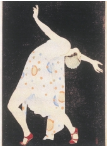
小早川清「ダンサー(レビュー)」 1932年(昭和7年)千葉市美術館蔵

入園料 3歳以上小学生200円、中学生以上400円 詳しくは町田リス園(☎7334・1001)へ。