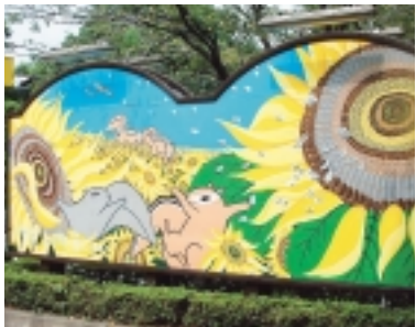
鮮やかに完成しました

広場の中ではタイワリスなど約400匹が放し飼いされており、来園者は餌をやるなどしてリスと触れ合うことができます。また、園内にはウサギやモルモットなどの小動物も飼育されています。 町田リス園のご案内 所在地 金井町733-1 開園時間 午前10時～午後5時 (10月16日からは午後4時まで)