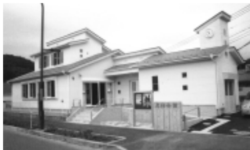
完成した「広袴会館」

地域の文化・市民活動及び福祉活動などの拠点となる、市内31番目の中規模会館「広袴会館」が完成しました。 会館の所在地は、広袴4丁目4番3で木造一部鉄骨造2階建て。延べ床面積は、217・42㎡で多目的ホール・和室・会議室などを備えています。