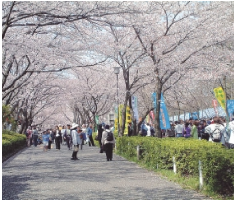
昨年のさくらまつり

春、町田はさくらで染まります。さくらまつりの会場となる「尾根緑道」は遠く丹沢や相模平野が望まれる市内のさくらの名所です。咲き誇るさくらを鑑賞しながら、ゆっくり散策してみませんか。 この尾根緑道には早咲きのさくらや遅咲きのさくらなど19種類・約460本があります。 約1・5キロの会場には、さくらをゆっくり鑑賞していただけるように、たくさんベンチを用意します。 期間中は、舞台や模擬店、町田駐車場はありません。お車でのご来場はできません。 当日は神奈川中央交通の路線バスをご利用下さい。 町田バスセンター11番乗り場(西友側の小田急線ガード下)発、町38系統市立室内プール行は増発(直行便)があります。運賃は250円です。