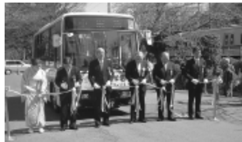
寺田市長(左から3人目)ら関係者がテープカットを行いました

3月21日から玉川学園地域コミュニティバスの試験運行が開始されました。当日行われた式典では、寺田市長のほか、市や地域組織・バス事業者・地元関係者などが出席してテープカットを行いました。運行開始を祝いました。使用される車両は小型低床ノン