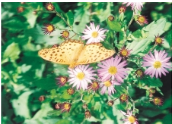
沢谷戸自然公園に飛ぶツマグロヒヨウモン (ノコンギク花上で吸蜜中 2004・10・25撮影)