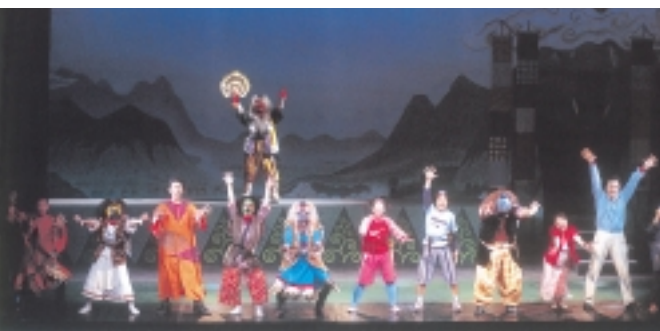
劇団ふるさとぎやらばん

町田市民センター、10日(木)＝忠生市民センター、14日(月)＝鶴川市民センター、いずれも午後1時30分から