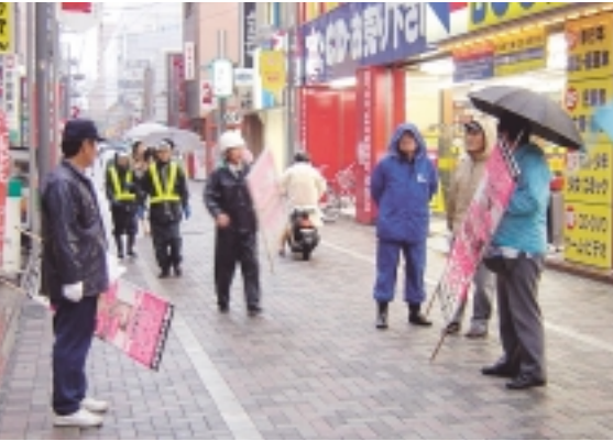
市民・事業者・行政が連携して実施した共同除却(中心市街地地区)

始した違反広告物除却団体と市内の不動産業者団体が初めて参加しました。 共同除却活動に先だって行われた意見交換会では、「市民団体間で連携して活動していきたい」、「市民団体が除却活動をしている姿を多くの市民に見てもらいたい」、「不動産業者で違反広告物を出しているのは特定の常習業者ばかりである」といった意見が活発に出されました。