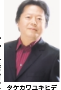
タケカワユキヒデ

75年「ゴダイゴ」を結成し、解散後は、ソロ活動の傍ら、作曲家、プロデューサーとしても活躍中。代表曲「モンキーマジック、ガンテラ、銀河鉄道999ほか」 2005年2月12日(土) 午後4時開演 2500円