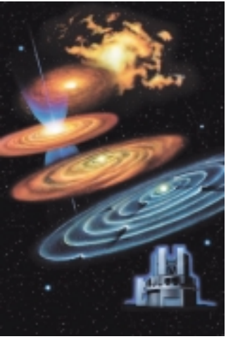
イラスト 高部哲也

開館時間 午前9時30分～午後5時 夏休み期間中の休館日 毎週月曜日 交通 J R淵野辺駅から徒歩20分、バスで「市立博物館前」下車徒歩1分、J R相模原駅または小田急線相模大野駅からバスで「宇宙科学研究本部」下車徒歩5分 町田市民ホール ☎750・8030