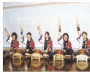
薬師太鼓あづま会(町田市)

日時 9月11日(土) 午後2時～4時(午後1時30分開場) 会場 町田市立中央図書館6階ホール 講師 作家、翻訳家・辻由美氏 対象 関心のある方 定員 110人(抽選) 申し込み 往復ハガキ(1人1枚)に、講演名・住所・氏名・年齢・電話番号を明記し、8月20日まで(必着)に中央図書館文学館開館準備担当係(〒194・0001 3、原町田3・2・9、☎7228・8220)へ。 【メモリアルコンサート】 宮川哲夫のヒット曲をお楽しみ下さい。 日時 9月15日(水) 午後6時30分開演 出演 三田明、アロハ・スターズ(元マヒナスターズ) 会場 町田市民ホール 費用 2500円 町田市民ホール ☎728・4300