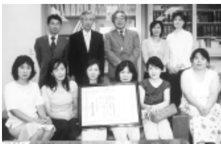
市立金井中学校広報委員会の皆さん

くちんは事前に接種してあります) 当日は住所・氏名の確認できるものをお持ち下さい。また、実際に譲渡するかどうかは、会場で面接の上、その動物との適性も含めながら主催者側で決定します。