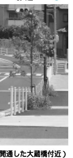
安全で快適な道路環境をいつまでも(今春開通した大蔵橋付近)

道の日のシンボルマークは、道路と人を図案化したもので、道によってもたらされる人と人とのふれあい、道路の大切さをイメージしています。