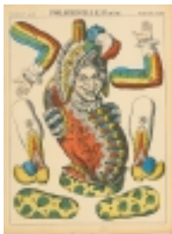
操り人形「プルチネッラ」(道化) グラフ 手彩色