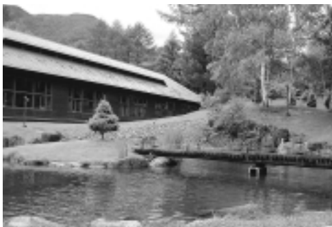
表1 利用者・申込期間

町田市自然休暇村は、秩父多摩国立公園内に位置し、高原野菜などで有名な川上村の標高1500メートルの山あいにて建てられています。 周囲はカラマツ・白樺を中心とした木々におおわれた自然の宝庫。村内には千曲川の支流・梓川も流れ、涼しげな川音を響かせています。 春のまぶしい新緑、夏の真っ青な空、秋の紅葉、冬の静寂...悠々とそびえるハケ岳や、高原野菜で畑一面が緑になる景観は、都会生活で緊張した心を優しくいやしてくれるでしょう。 避暑、ハイキング、自然観察、釣り、川遊び、テニス、スキーなど、目的に応じ1年を通してご利用いただけます。