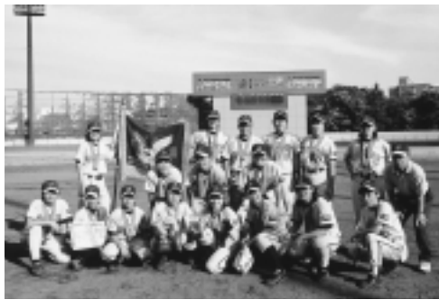
町田スパークライズ

市内の軟式野球3チームがこの夏の全国大会代表に選ばれ、それぞれ健闘しました。 町田玉川学園少年野球クラブは、成瀬台小・南大谷小などに通う小学生のチームで、町田市代表として都大会で準優勝し、都代表として8月2日から行われた高円宮賜杯第23回全日本学童軟式野球大会に出場しました。1回戦は鳥取代表に大差で勝ちましたが、2回戦では昨年度全国大会準優勝の新潟代表に残念ながら敗れました。 また、第48回全国高校軟式野球選手権大会が8月25日から開催され、硬式野球部が甲子園に出場した日大三高が、こちらは2年連続で都代表として出場しました。寺