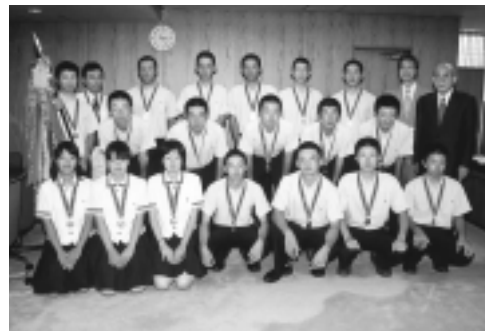
日大三高軟式野球部

町田市長を大会前に訪ね、まず1勝を」と誓い、見事初戦を突破しました。準々決勝では北部九州代表四日市高校(大分)と対戦し、一時は6点リードの場面もありましたが惜しくもサヨナラ負けを喫しました。 8月9日から江戸川区内で開催された第14回全日本女子軟式野球選手権大会に出場したのは町田スパークライズ。中学生から社会人で構成される、過去2回の全国優勝を誇る女子チームです。初戦から順当に勝ち進み関西代表チームとの決勝戦に臨みました。決勝では敗れたものの、堂々と準優勝旗を持ち帰りました。各チームとも来年に向けて誓いも新たに、熱気あふれる全国大会が終了しました。来年も健闘を!