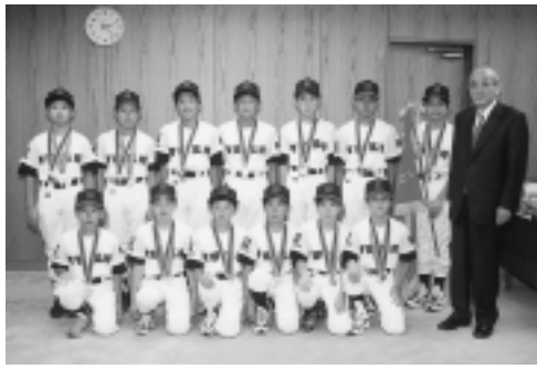
町田玉川学園少年野球クラブ

市内の軟式野球3チームがこの夏の全国大会代表に選ばれ、それぞれ健闘しました。 町田玉川学園少年野球クラブは、成瀬台小・南大谷小などに通う小学生のチームで、町田市代表として都大会で準優勝し、都代表として8月2日から行われた高円宮賜杯第23回全日本学童軟式野球大会に出場しました。1回戦は鳥取代表に大差で勝ちましたが、2回戦では昨年度全国大会準優勝の新潟代表に残念ながら敗れました。 また、第48回全国高校軟式野球選手権大会が8月25日から開催され、硬式野球部が甲子園に出場した日大三高が、こちらは2年連続で都代表として出場しました。寺