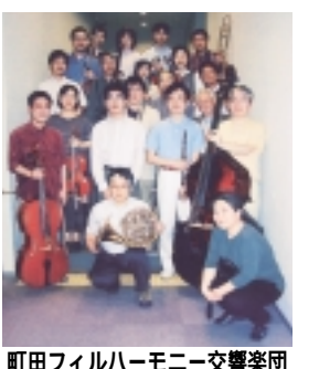
町田フィルハーモニー交響楽団