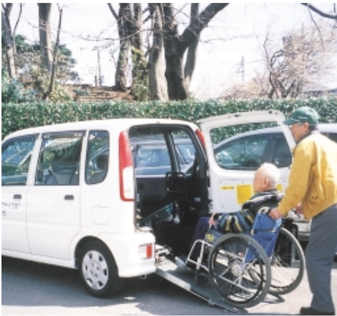
親切・安全をモットーに活躍するお出かけサービス