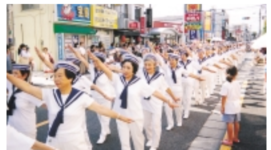
市内栄通りのパレードに参加する踊りのグループ