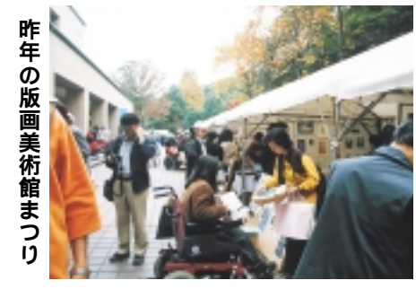
昨年の版画美術館まつり

10月18日・19日に開催する「第5回ゆらゆうら版画美術館まつり」のメインイベントである「アートバザール」では、作品をつくる人と鑑賞する人の交流の輪を広げる場作りを目指して、出展者を募集します。 対象 作品を自分で管理販売できる団体・グループ 内容 絵画、版画、彫刻、陶芸、ガラス等の美術作品 出展料 1グループ10000円 チャリティ 売上額の10%申し込み 所定の申込書(同館にあります)に必要事項を記入し、7月15日まで(必着)に郵送で「ゆらゆうら版画美術館まつり」運営委員会事務局(〒194・0013、原町田4・28・