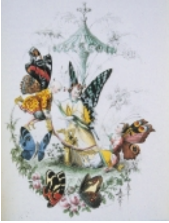
アメデ・ヴァラン 1818~1883 『蝶』より 1852年刊 銅版 手彩色