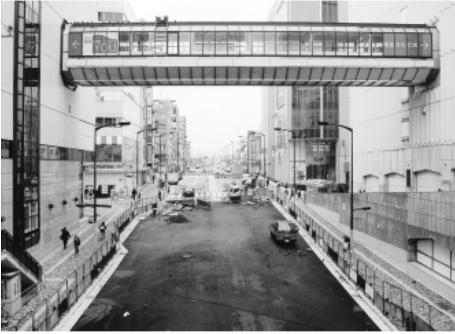
完成間近の3・4・11号線