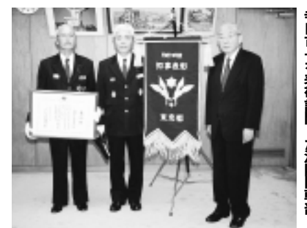
寺田市長を表彰訪問した消防団幹部