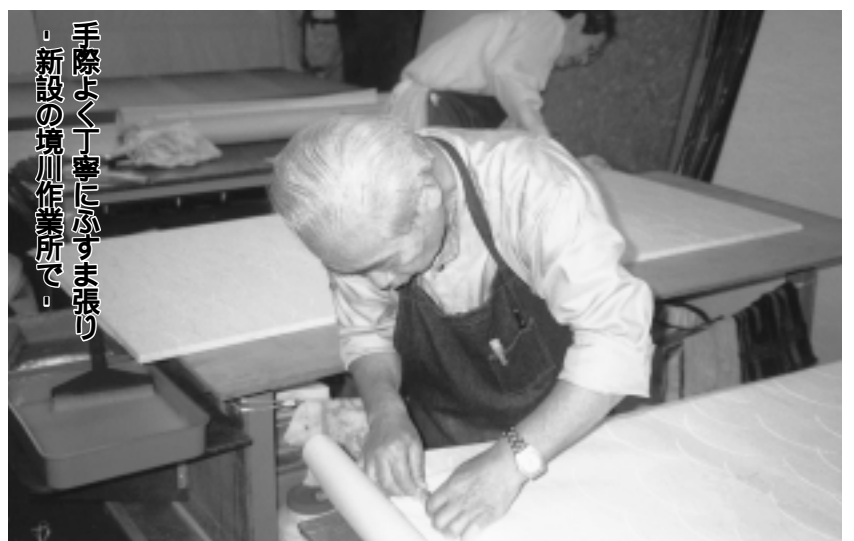
手際よく丁寧にふすま張り。新設の境川作業所で。

その他次のような仕事もしています。 刃物研ぎ、エアコン洗浄、ビル清掃、和服仕立て、ビデオ作成、チラシ配布、紙すき、葬祭など