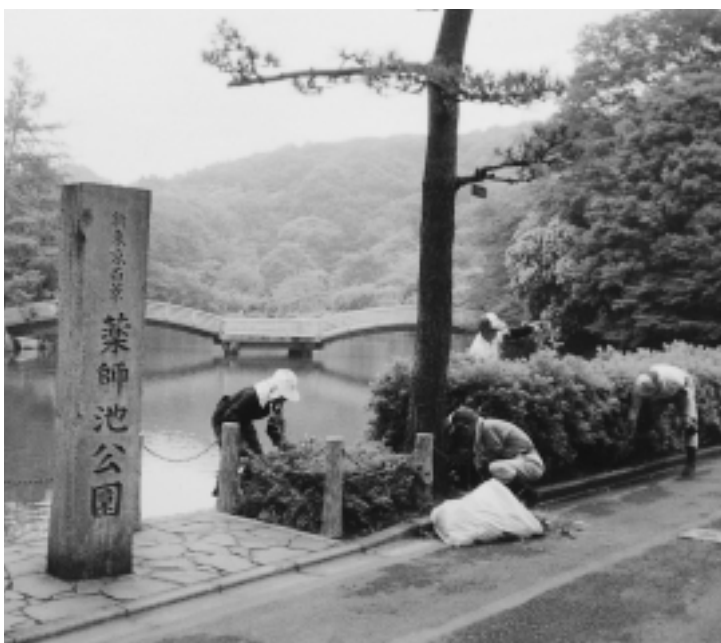
街のオアシスはいつもきれいに一薬師池公園の除草に励む

センターは法律によって位置づけられた公益法人で、社会的に信頼されている団体です。国や都、市から事業の運営に必要な経費が補助されています。 会員になるには 市内にお住まいで60歳以上の働く意欲があり、シルバー人材センターの働き方や理念に賛同される方はどなたでも会員になれます。 入会手続き 入会説明会に出席し、入会申込書に顔写真を添え、センターに出、理事会の承認を得て会員になります。その際、所定の会費(1000円)を納めていただきます。 就業と配分金 センターに入会し、働くことによって一定の配分金が交付されます。多くの収入を望む方にはセンターの仕事は、なじみません。お金を得ることだけが目的ではなく、また会員になっても就業や収入の保証はないからです。 事故防止対策と傷害保険の加入