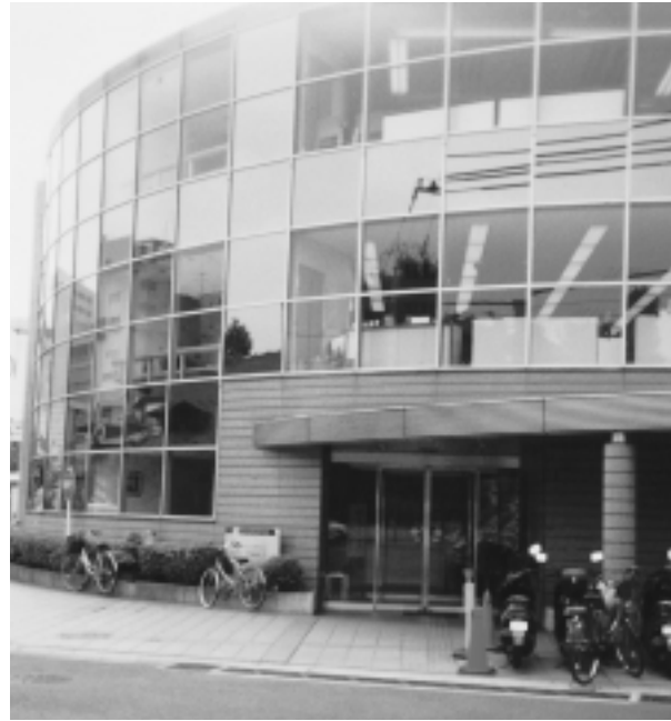
わくわくプラザ町田

安全管理委員会の活動を通じ積極的な対策を講じています。仕事上のけがや仕事先での損害などの補償のためシルバー保険に加入しています。 行き届いた技能訓練 未経験の仕事へのチャレンジをセンターに入会しても希望する仕事になかなか就けない場合があります。特に、事務系の仕事は希望者が多く就業機会が少なくなっています。 そこで、センターでは、他の仕事にチャレンジする会員のために各種の技能訓練や講習会を行っています。