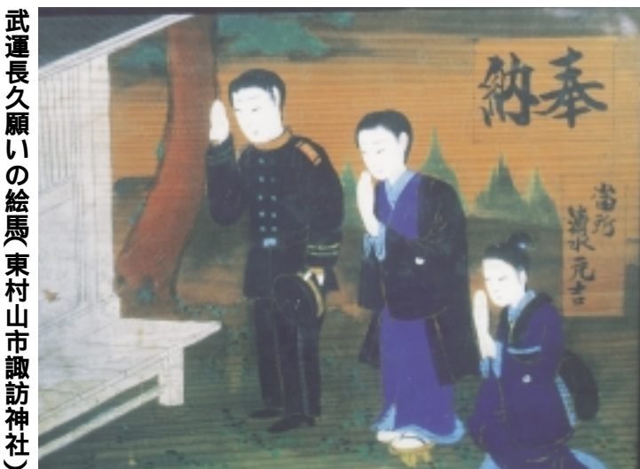
武運長久願いの絵馬(東村山市諏訪神社)

いずれも会場は同館閲覧室、定員40人(先着順)、時間は午後2時〜4時です。7月23日から受付を開始します。ご希望の方は電話で同館(☎734・4508)へ。 交通 小田急線町田駅北口POPビル先21番乗り場から本町田経由「野津田車庫」行きまたは「鶴川駅」行きバスで「袋橋」下車/小田急線鶴川駅0番乗り場から「野津田車庫」行きまたは本町田経由「町田駅」行きバスで「綾部入口」下車