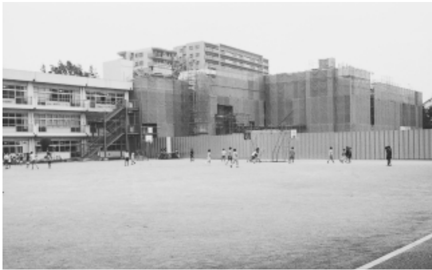
体育館・プールの建設が急ピッチで進む町田一小

・そ・ぼっ)、デゴイチまつり、鼓笛まつりなどを開催。 【大地沢青少年センターの管理】 7666万7千円 【中央図書館の管理運営】 3億7162万1千円 図書購入など。 【文学館の建設】 1697万3千円 (仮称)文学館建設懇談会委員謝礼、調査委託など。 【博物館事業】 7156万8千円 写された国宝展など8回の展覧会を開催。 【ひなた村事業】 615万9千円 定例子どもグループの育成、フェスタひなた村などを開催。 【自然休暇村の管理】 1億1931万円 【国際版画美術館事業】 9306万5千円 極東ロシアのモダニズム1918~1928展など7回の展覧会を開催。