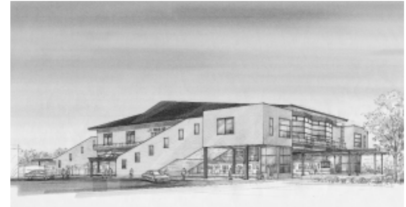
0西相原駅完成予想図。駅舎が改良され、2004年3月に完成の予定です。

【道路の新設・改良】 16億2203万6千円 忠生441号線(常盤町)外12路線の改良工事、町田572号線(本町田)外4路線の歩道整備工事、相原駅自由通路及び橋上駅舎化工事委託など。 【舗装道路の改良】 3億5000万円 南1001号線(小川)外6路線の舗装工事など。 【私道等の整備】 4697万4