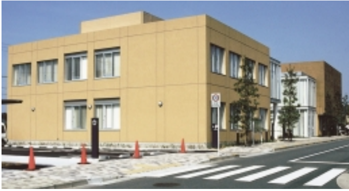
左側が地域のコミュニティセンター「三輪センター」、右側1階が高齢者在宅サービスセンター「デイサービス三輪」