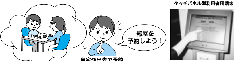
施設で予約 タッチパネル型利用者用端末

○7月の申し込み対象施設 地域センター11ヶ所9月使用分の会議室等・10月使用分のホール▽町田市民フォーラム1ヶ所9月使用分のホール