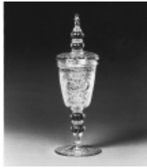
双頭の鷲文蓋付ゴブレット チェコ 18世紀前半高さ36.5cm 儀式 乾杯用ワイングラス

市立博物館が所蔵するチェコガラスを はじめ、ベネチアのレースガラス、イギ リスやアイルランドなどのカットガラ ス、スペインのワインを飲むための独特 の形をしたガラス器、フランスのアル ・ヌーヴォーのガラスなどをご鑑賞下 さい。 期間 6月25日(火)まで 水曜日は休館です。 開館時間 午前10時～午後7時 会場 街かどギャラリー 交通 小田急線・JR横浜線町田駅下 車、徒歩5分 市立博物館 ☎726・1531