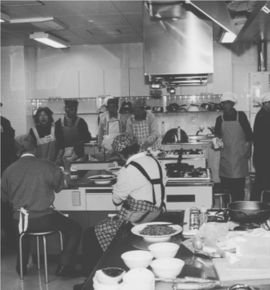
今年2月に行われた男女平等フェスティバルー男の料理教室「男の自立は料理から」

基本目標 シェンダーに敏感な視点に基づいた性の尊重 女性が妊娠・出産について、主体的に決定する力を身につけられるように支援を行います。