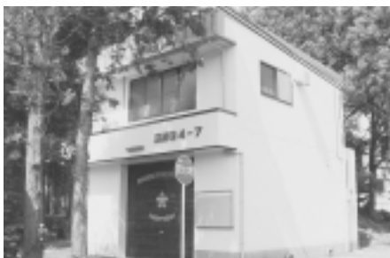
上小山田の消防器具置場

玉川学園の町田市消防団第一分団第5部消防器具置場(敷地面積275.95平方メートル、軽量