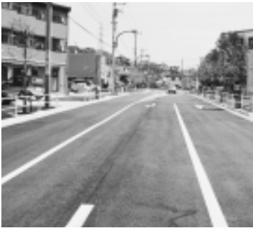
都市計画道路3・4・6号線

都市計画道路3・4・6号線はJR成瀬駅から都市計画道路3・4・29号線に接続し、成瀬街道を結ぶ幹線道路です。幅員は18