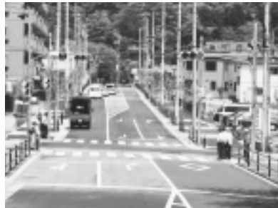
都市計画道路3・4・29号線