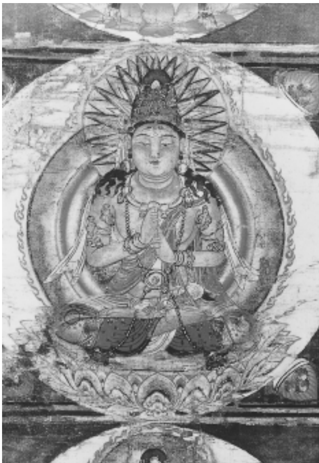
「石元泰博 教王護国寺 伝真言院曼荼羅」

会場 総合体育館 種目 形體技の部 小学生低・中・高学年 中学生男女 高校生男女 シニアの部 小学生中・高学年の男・女 中学生男女 高校生男子 一般男子 有級一般女子 一般男子有級