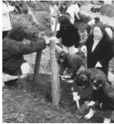
昨年11月に行われた相原市民植樹

緑地保全基金に加え、植樹事業にも寄付を活用できるようにしました。緑地保全基金条例は、貴重な緑を円滑に保全していく目的で昭和60年に制定され、市ではその運用により緑地の確保に努めてきました。しかし従来、基金の使途は、緑地保全目的とした用地買収事業に限定されていたため、さらに内