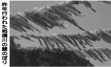
昨年行われた相模川の鯉のぼり

4月29日(祝)から5月5日(祝)までの7日間、子どもたちの健やかな成長を願って、相模川高田橋上流(相模原市田名)の五月晴れの大空に鯉のぼりが泳ぎます。ご家庭で使用されなくなった鯉のぼりがありましたら、3月29日までに下記の送付先に直接または郵送でご応募下さい。おさんが初節句の場合は、鯉のぼりに名前を記して泳がせます(5m以上に限ります)。名前と初節句であることを書き添えてお送り下さい。なお、材質や傷み具合によっては揚げられないことがあります。また、泳がせることが困難な鯉のぼりについては、丁寧に供養させていただきます。