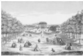
西洋眼鏡絵20点のうち

当館では版画の歴史を多面的・総合的に理解できる質の高い作品の収集に努めています。 本展では2000年度後半から2001年度前半にかけて新たに収蔵された作品の中から、主要な