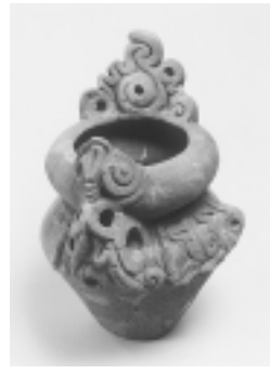
深鉢 縄文時代(忠生遺跡)

展では市内出土の代表的な考古資料を、縄文時代を中心に、旧石器時代から中世にわたって約450点展示し、出土遺物から見た町田市の通史を紹介いたします。 期間 1月5日(土)～2月24日(日) 月曜日は休館です(ただし1月14日、2月11日は開館) 1月15日・2月12日は休館 時間 午前9時～午後4時30分 【ギャラリー】 埋蔵文化財担当による展示