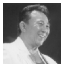
6歳未満のお子さんは入場できません。

1月26日(土) 午後2時開演 サン町田旭体育館1階アリーナ 指定席3000円 自由席2500円 新春に寺内タケシがお贈りする華麗なるエレキギターの世界! 【電話予約受け付け中】 入場希望の方は電話で市民ホール(728・4300)へ。