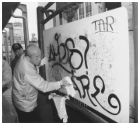
落書きを消す寺田市長（JR横浜線町田駅前のまだあんない板）

市の宣言 男女平等参画都市宣言 非核平和都市宣言 青少年健全育成都市宣言 交通安全都市宣言