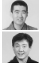
春風亭柳好 柳家喬太郎

会場 なるせ駅前市民センター 定員 150人(申し込み順) 申し込み 電話で選挙管理委員会事務局(☎724・2168)へ。 国際版画美術館 創作講座リトグラフ 初心者を対象に、リトグラフの多色刷り作品を作ります。リトグラフの特徴を知り、時間をかけて自分らしい作品を作りたい方におすすめです。 期日 10月16日、12月4日の毎週土曜日(全8回) 時間 午後1時30分～4時30分 会場 当館版画工房 講師 版画家・清原司都子氏 定員 10人(市内在住の方) 費用 8000円