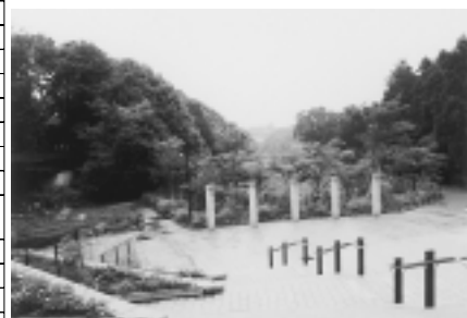
近隣の施設—忠生公園

(注意) 14 ⑱(68 A)宅地(保留地)の一部に、工作物があります。 14 ⑲(106 A)宅地(保留地)は当面の間、公共下水道の使用はできません。