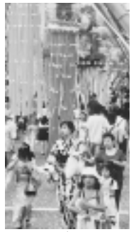
選のついでに選ばれています。地元の人たちが工夫を凝らして作り上げた色とりどりの竹飾りが華やかさを競い合い、昨年は3日間で延べ38万人の出入がありました。

取検査(体部については医師が必要と認められた方のみ受診できます) 子宮筋腫等で手術を受けた方は、細胞が採取できる場合とできない場合があります。事前に医師とご相談の上、検診を受けて下さい。 費用 乳がん検診1700円 子宮がん検診(頸部のみ)1000円 頸部+体部2000円 支払方法 受診する際に病・医院に現金でお支払い下さい。 【非負担者について】 この方は無料となります。 福老人医療証をお持ちの方