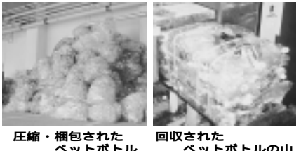
圧縮・梱包されたペットボトル(左)と回収されたペットボトルの山(右)

皆さんが実践しているごみを減らす良いアイデアがありましたら、環境総務課 ☎797・0530(まで)ご連絡下さい。