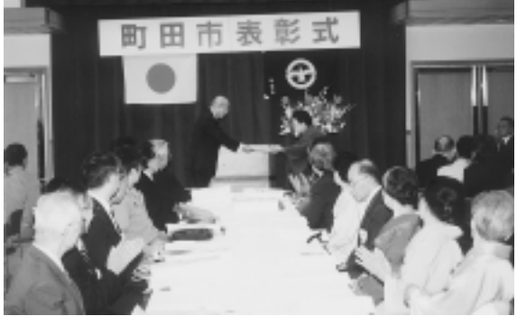
寺田市長から表彰状と記念品が贈られました

町田市福祉のまちづくり推進検討委員会の答申に基づき、福祉のまちづくり推進組織「町田市福祉のまちづくり推進協議会」を設置するための改正と、子育て支援策および子育て環境整備推進を規定するための改正を行う「町田市福祉のまちづくり総合推進条例の一部を改正する条例」対象児童の年齢を小学校就学前までに拡大し、2歳児までは保護者の所得制限をなくす「町田市乳幼児の医療費の助成に関する条例の一部を改正する条例」などです。