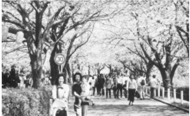
天候に恵まれたさくらまつり

「2001まちださくらまつり」が4月7日、8日に尾根緑道(約1.5km)を会場として開催されました。両日も天候に恵まれ、2日間の入出は約16万人。満開のさくらが少し散り始めた会場は、終日、大勢の花見客でにぎわいました。今年も、防災相互援助協定を結んでいる川西町、増穂町、長野市、川上村と、当市と友好関係にある沖繩市、大島町、日の出町などの友好都市コーナー、長野県や山形県などの県人会による、ふるさと自慢コーナーなどの様々な地域の特産品販売が好評でした。メインステージでは、伝統芸能、