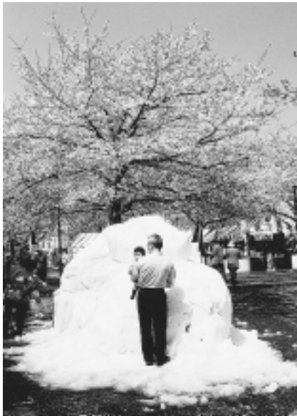
川西町からの雪だるま

【成瀬川桜まつり】尾根緑道とは別に成瀬の恩田川緑道とその周辺で行われた第一回「成瀬川桜まつり」も両日で約5万人の花見客で大盛況でした。