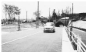
都市計画道路3・4・42号線

道路整備が進む 都市計画道路3・4・42号線 市道南873号線 市では道路や下水道など、都市基盤の整備を重点施策として位置付け、その整備を進めていますが、このほど都市計画道路3・4・42号線と市道南873号線の道路の開通式が行われ、通行できるようになりました。 東京都の推進している交差点改良事業「すいすいプラン」による道路改良などと併せて、