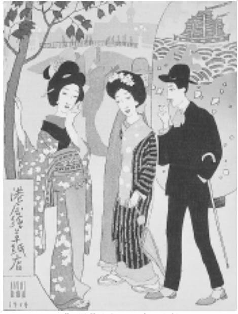
港屋絵草紙店 1914年 木版