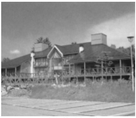
たてしな自然の村の食堂、集会施設