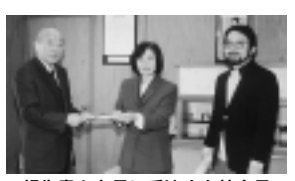
報告書を市長に手渡す上林会長