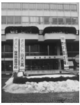
ガンバレ！日大三高、桜美林高

選抜そろって出場が決定 第77回選抜高校野球大会に年ぶり15回目、桜美林高は18日大三高と桜美林高がそろって出場することが決まりました。町田市から2校そろって出場するのは初めての快挙です。