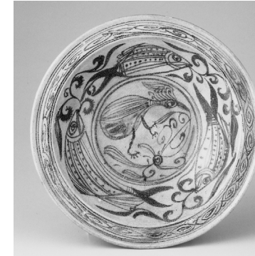
青磁鉄絵魚鳥文鉢 タイ・シーサッチャナーライ窯 アユタヤ時代(15-16世紀)