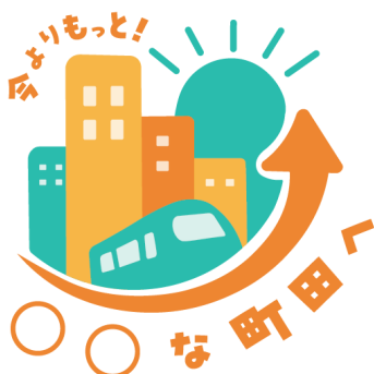
町田駅周辺開発応援ロゴマーク 決定デザイン