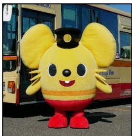
神奈中マスコットキャラクター 「かなみん」