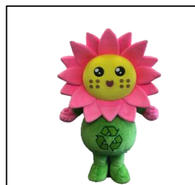
町田市エコキャラクター 「ハスのん」