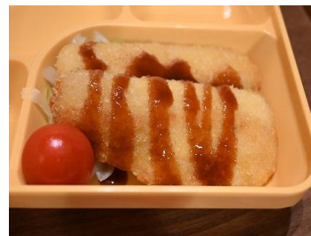
11月 かますのフライ

持続可能な漁法と言われている「定置網漁」で獲ったかますを、帰港後1時間以内に新鮮なまま手作業で加工しています。