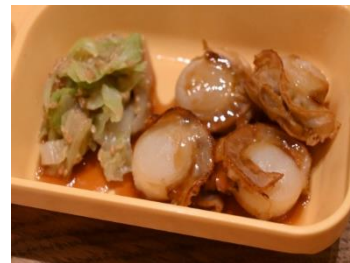
12月 ほたての照り焼き

ほたての耳をつるす「耳づり」という方法で養殖しています。陸奥湾で育てられたほたては、肉厚で甘く、ぷりぷりとした弾力が魅力です。