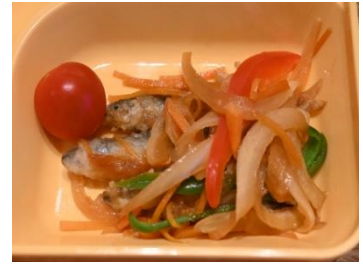
1月 小鮎の南蛮漬け

朝獲れの小鮎を漁が終わり次第、一匹ずつ冷凍しているため、獲れたての美味しさをそのまま提供します。