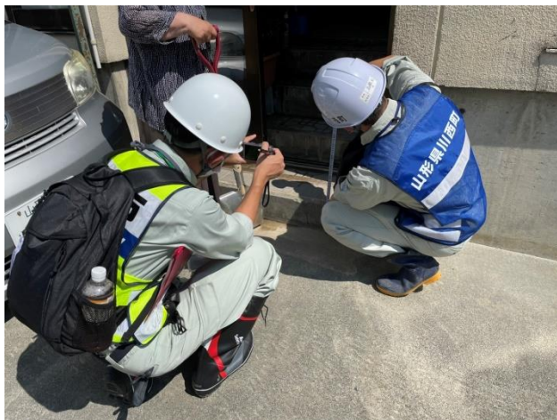
住宅被害認定調査の様子