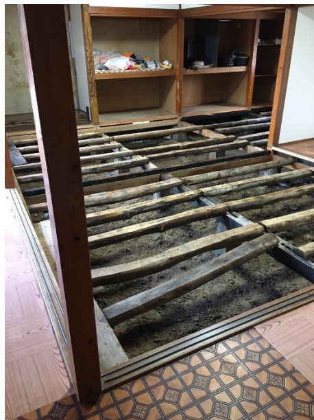
調査対象建物の様子