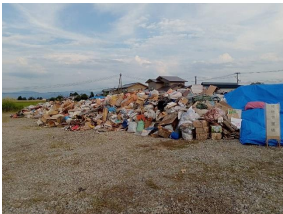
災害廃棄物仮置き場の様子