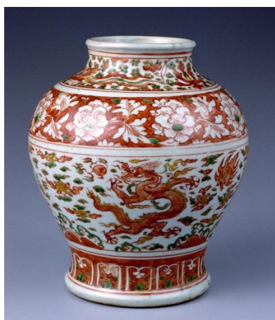
五彩雲龍文壺 中国 16世紀 高さ 28.5 cm

本展覧会は東京2020オリンピック・パラリンピックの機運醸成を目的とした文化芸術の取り組みである「町田市文化プログラム」のひとつです。